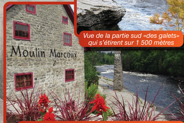
Vue du moulin Marcoux et de la rivière Jacques-Cartier à partir du pont rouge.