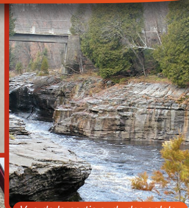
Vue de la partie sud «des galets» qui s'étirent sur 1 500 mètres